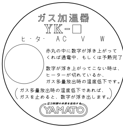
△B 銘板詳細(尺度 2:1)