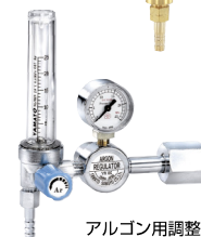
アルゴン用調整器