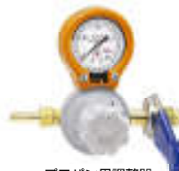
プロパン用調整器