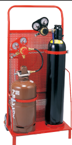
ウエルディングバック