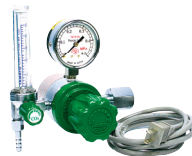
ヒーター付調整器