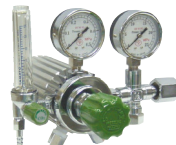
ノーヒーター調整器