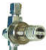
溶接用ガス節約器エコ・プラス