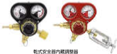
乾式安全器内蔵調整器