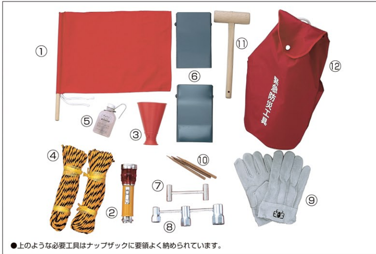
●上のよう必要工具はナップザックに要領よく納められています。

※都道府県によっては、内容が異なる場合があります。 例）神奈川県タイプ Heプラグ LPプラグ ) 必要 別売にて対応させていただきます。