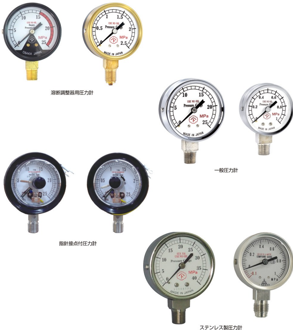
溶断調整器用圧力計